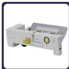
バケットユニット